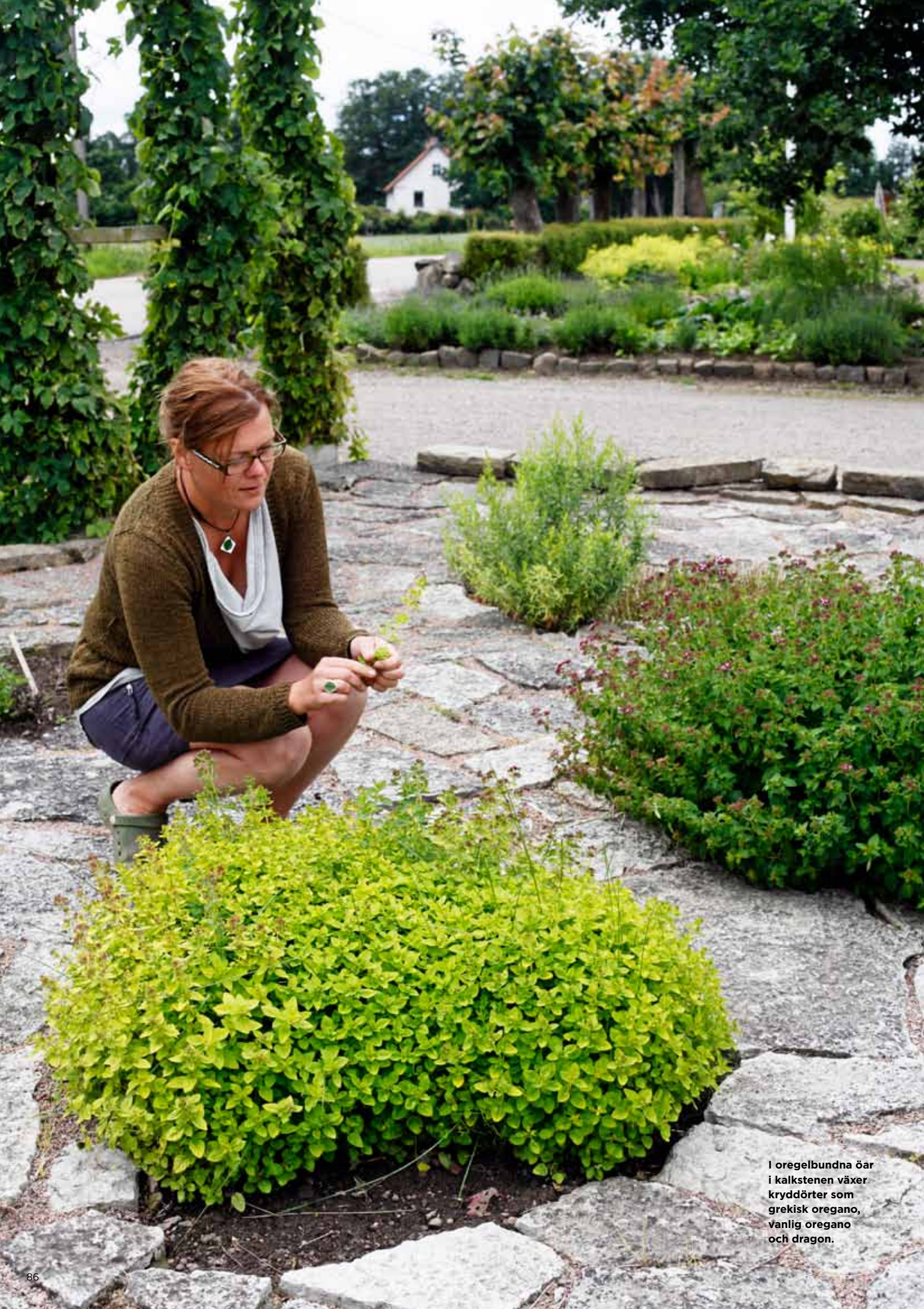
I oregelbundna öar i kalkstenen växer kryddörter som grekisk oregano, vanlig oregano och dragon.