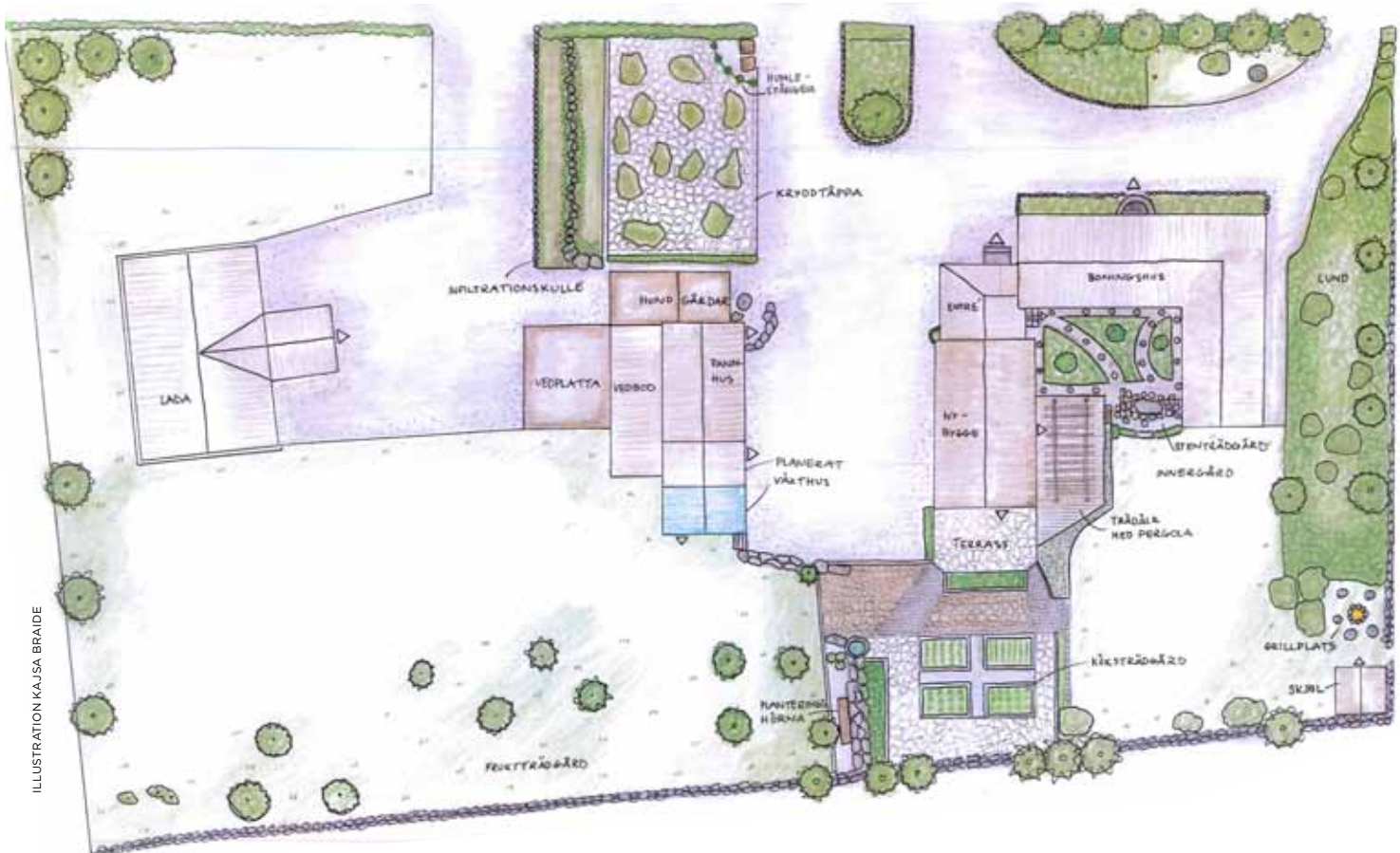
ILLUSTRATION KAJSA BRAIDE

Projektet pågår. Tanken är att vinrankor och blåregn ska bilda ett tak över terrassen. Det kanske tar tio år till. ■