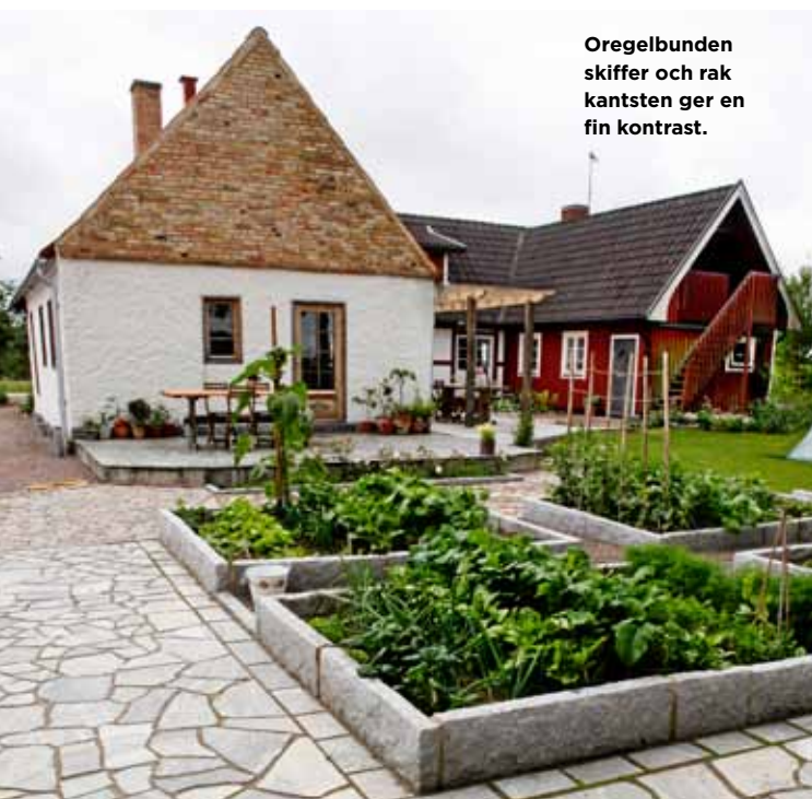
Oregelbunden skiffer och rak kantsten ger en fin kontrast.