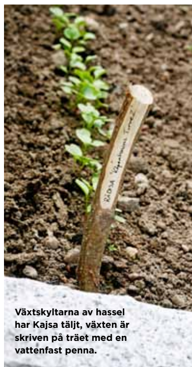
Växtskyltarna av hassel har Kajsa täljt, växten är skriven på träet med en vattenfast penna.