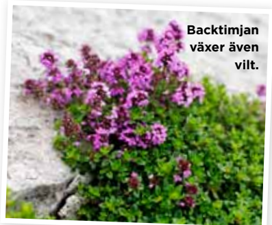
Backtimjan växer även vilt.

”Kryddväxterna tål att man är lite tuff mot dem, och det är bra att de har en avgränsad plats.”